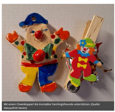
Mit einem Clownklupperi die Innstädter Faschingsfreunde unterstützen.